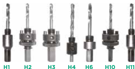
H1 H2 H3 H4 H6 H10 H11 Caixa