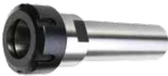
PORTA-PINÇA CM AÇO DIN 228-A