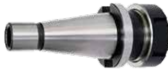
PORTA-PINÇA ISO AÇO DIN 2080