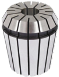
PINÇA ER-40 DIN 6499 AÇO CROMO TEMPERADO