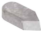
TIPO E/SMS - (SIMILAR DIN) EMBALAGEM COM 10 UNIDADES