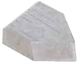
TIPO E DIN 4950 EMBALAGEM COM 10 UNIDADES