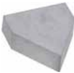
TIPO F/SMS DIN 4950 EMBALAGEM COM 10 UNIDADES