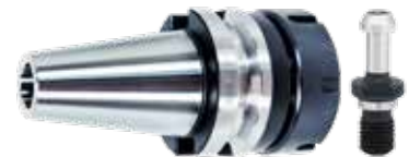
PORTA-PINÇA BT AÇO MAS 403 - BT