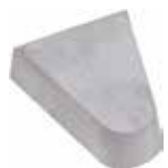
TIPO G/SMS DIN 4950 EMBALAGEM COM 10 UNIDADES