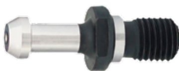
PINO DE FIXAÇÃO BT