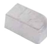
TIPO B - (Corte à esquerda)